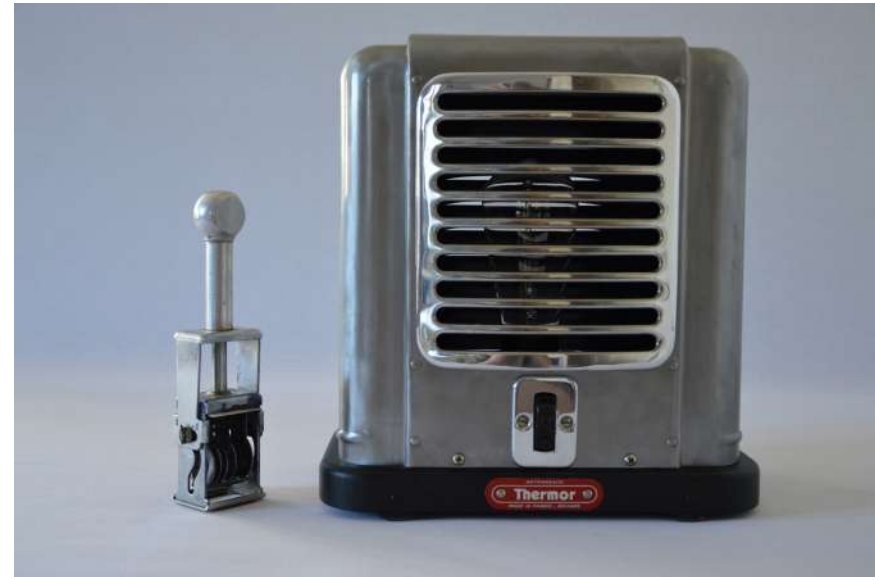
Lampe ArtJL226 issue d'un radiateur Thermor - Années 50'