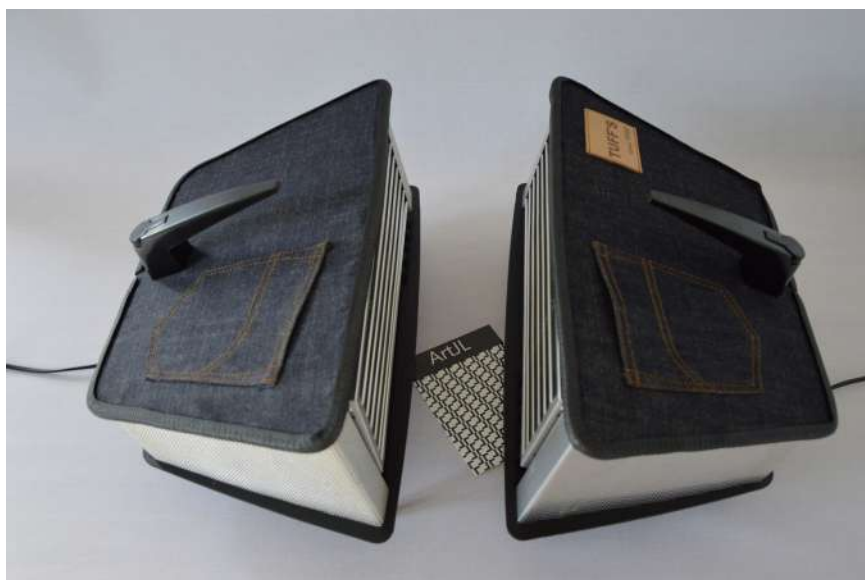
Lampes ArtJL141 & 142 issues de radiateurs Calor - Années 70' Collaboration avec la marque de jeans français Tuffery