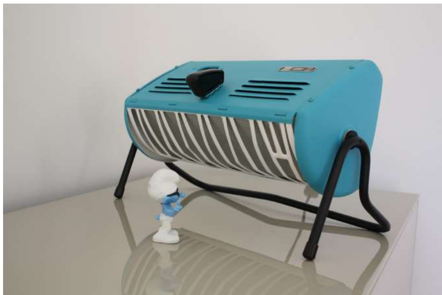
Lampe ArtJL58 issue d'un radiateur Philips - Années 70'