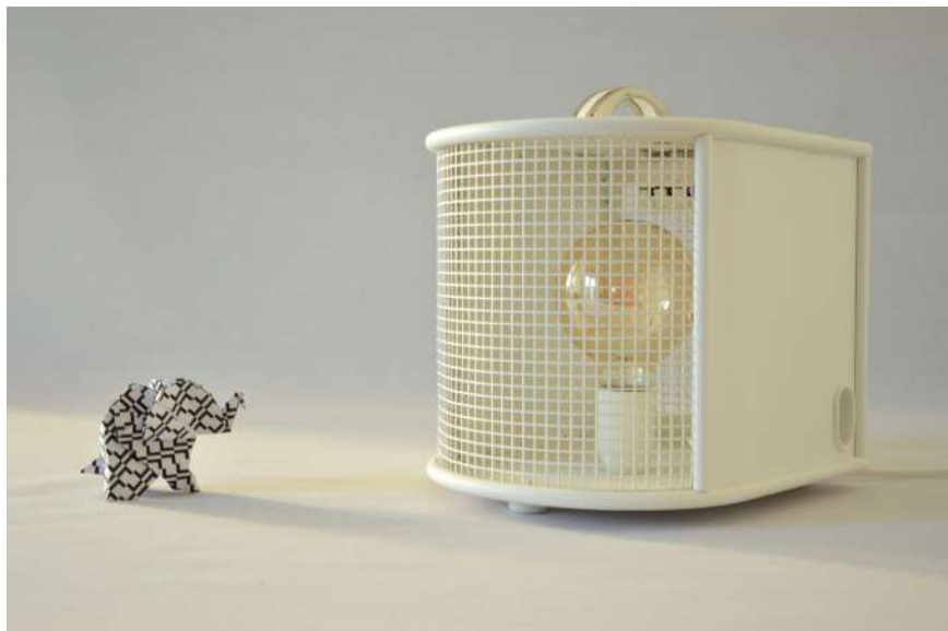
Lampe ArtJL211 issue d'un radiateur Thermowind - Années 60'