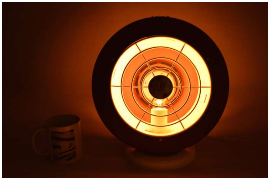
Lampe ArtJL240 issue d'un radiateur Elge - Années 60'