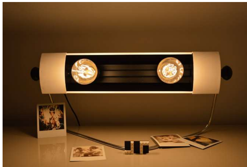
Lampe ArtJL157 issue d'un radiateur PRL - Années 70'