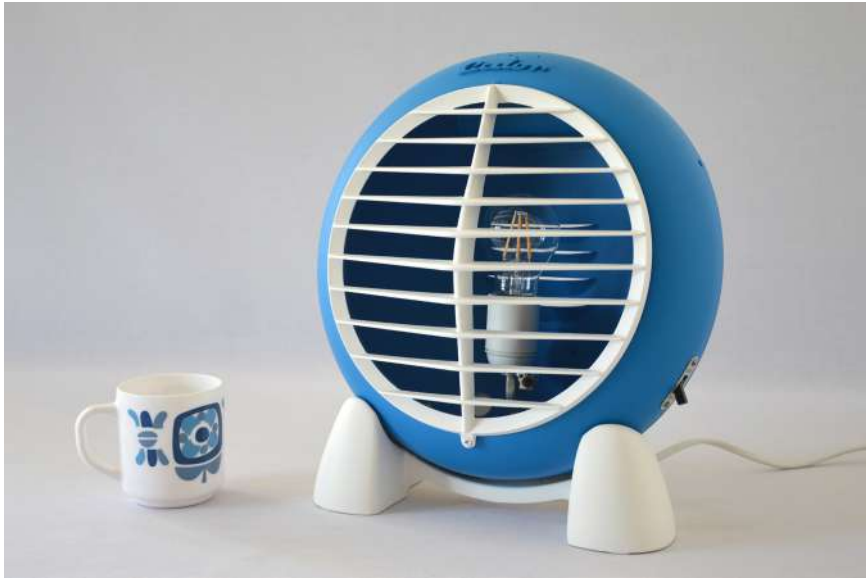
Lampe ArtJL183 issue d'un radiateur Calor - Années 60'