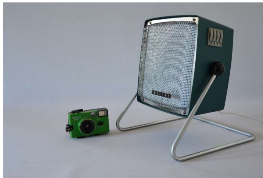
Lampe ArtJL207 issue d'un radiateur Philips - Années 70'