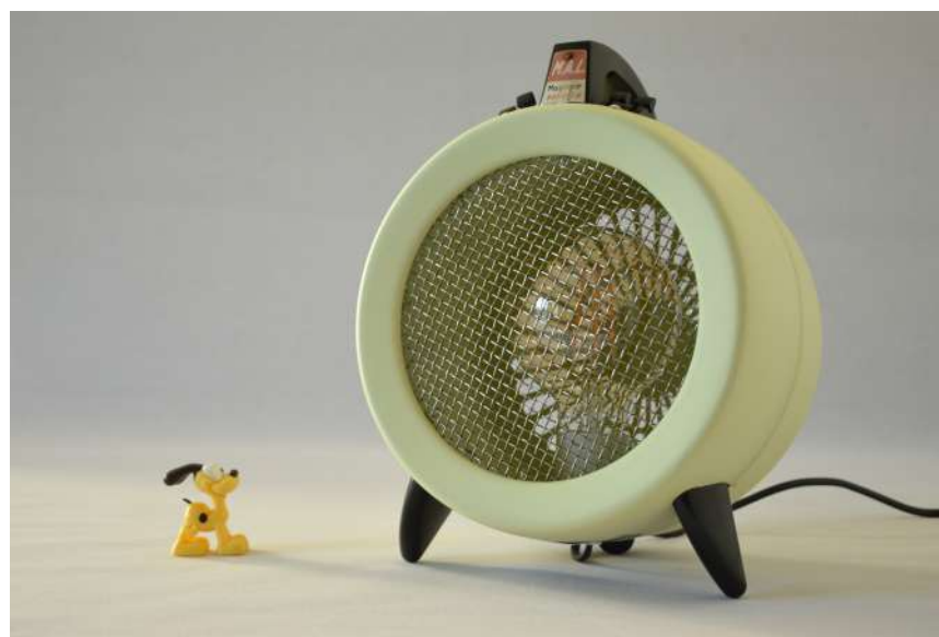
Lampe ArtJL219 issue d'un radiateur Magic Air - Années 60'