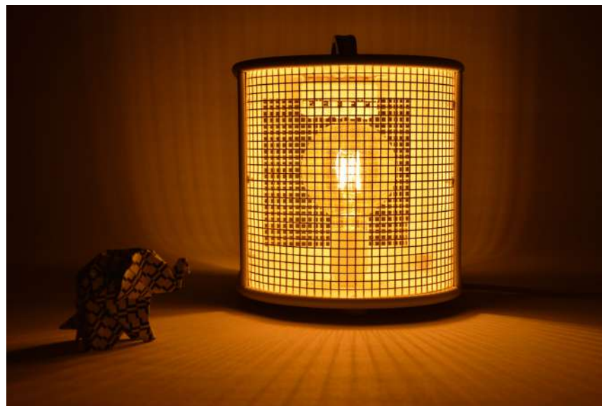
Lampe ArtJL211 issue d'un radiateur Thermowind - Années 60'