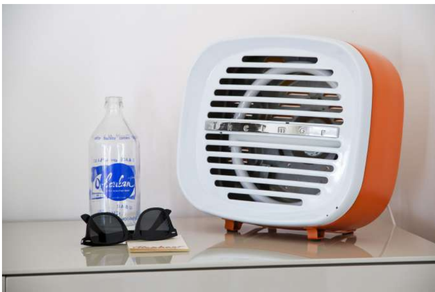
Lampe ArtJL230 issue d'un radiateur Thermor - Années 60'