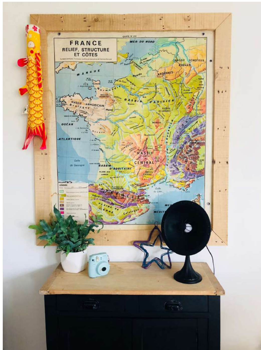
Lampe Art JL227 issue d'un radiateur Calor des années 40' vendue en Savoie