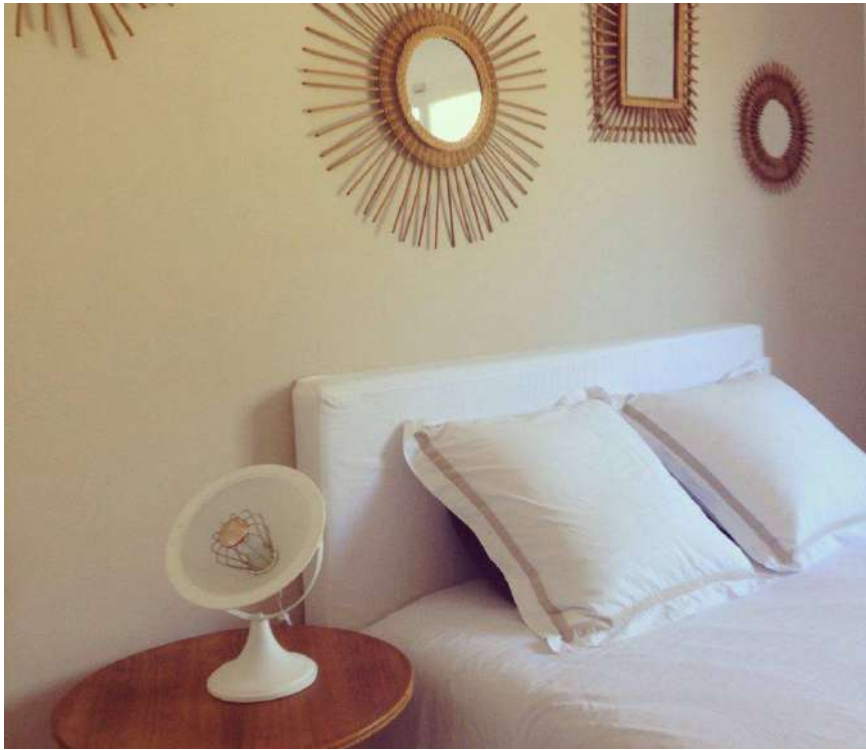
Lampe ArtJL235 issue d'un radiateur Calor des années 50' vendue en Franche-Comté