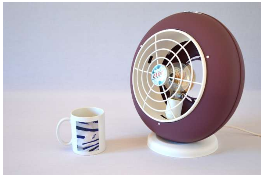
Lampe ArtJL240 issue d'un radiateur Elge - Années 60'