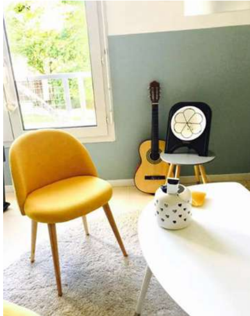
Lampe ArtJL132 issue d'un radiateur Toilectro des années 30' vendue en Loire-Atlantique