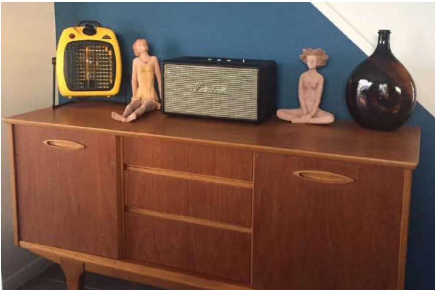
Lampe ArtJLg7 issue d'un radiateur Ismet des années 60' vendue en Savoie