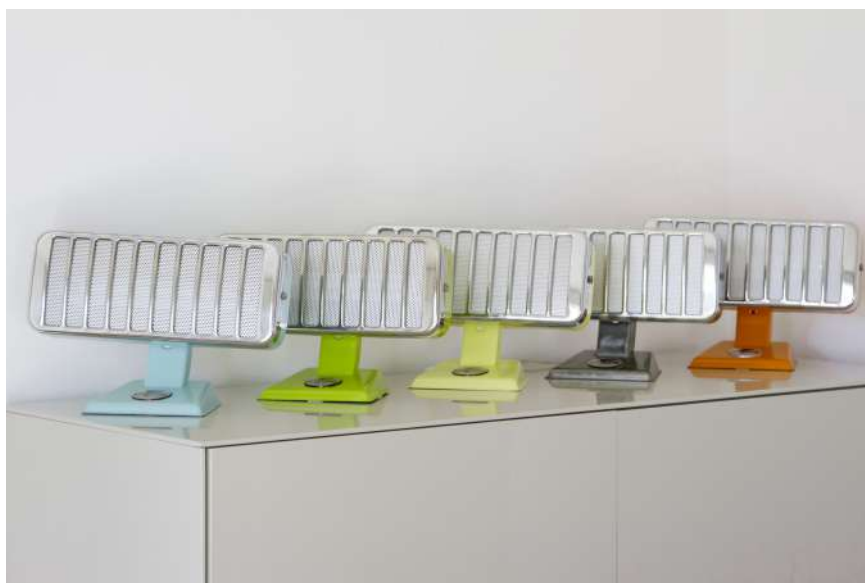
Ensemble de lampes issues de radiateurs Thermor - Années 60'