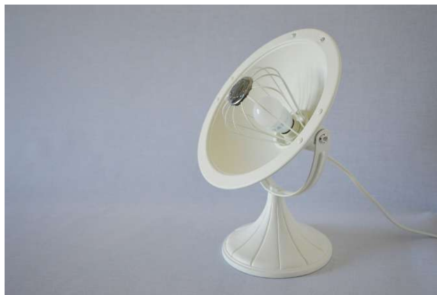
Lampe ArtJL245 issue d'un radiateur Calor - Années 50'